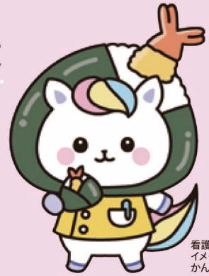
看護の日 イメージキャラクター かんこちゃん

平素より愛知県看護協会・ナースセンター事業にご支援ご協力をいただきありがとうございます。 歴史的な暑い夏がようやく終わり、爽やかな秋を迎えました。医療関係者の皆様、いかがお過ごしでしょうか。今年はナースセンターにとって大きな変化の年になりました。マイナンバー制度を活用した看護職の人材確保システムの構築が始まり、さらに、30年ぶりに人材確保法の基本指針が見直され「看護補助者の確保・定着推進事業」がナースセンター事業となりました。様々な変化が起きている今だからこそ、私たちナースセンターは、看護職の皆様が生涯を通じて働き続けられる環境作りを目指していきたいと考えています。